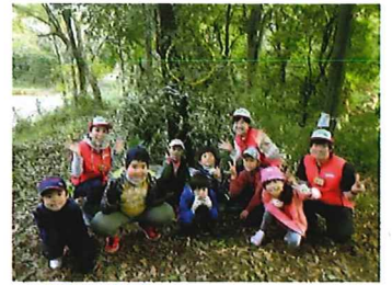
ひみつ きち 秘密基地もできちゃった!

た き りよう 立ち木を利用してハンモックを作り、大きなブラン コも作って、自分たちだけの「森のあそび場」 をつくらう。森の中が素敵なワンダーランドになる こと間違いなし!!