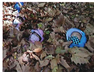
おちばのふとんで「おひるね」

おちばをあつめて「おちばのやま」をつくったら、おちばのやまにジャンプしよう！おちばであそんだあとは、もりのなかで「クリスマスパーティ」だ。クリスマスケーキもつくってたべよう。